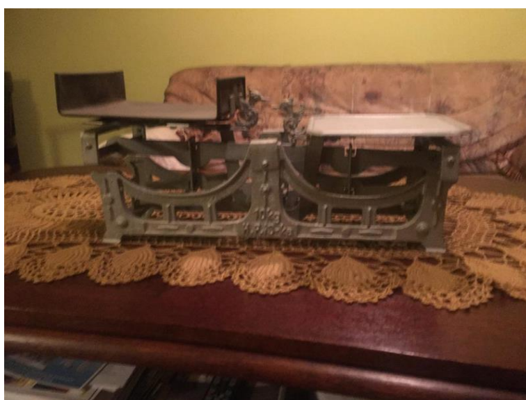
Zdjęcia przedstawiają pamiątki rodzinne Michasi. Po prawej waga sklepowa prababci.